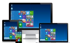
Ihr neuer Arbeitsplatz

Können Sie ihre Branchenlösung starten, haben die Office Palette zum arbeiten und verfügen über eine komplette Mailfunktion inklusive gemeinsame Kalender, kombiniert mit einer virtuellen Telefonanlage, dann haben Sie schon fast ihre ganze IT zentralisiert. Auch hier können Sie mit dem neusten Standard der IP Telefonie glänzen und Funktionen nutzen, die sonst nur teure interne Telefonanlagen bieten. Sei es eine Ringwahlschaltung, verschiedenste Telefonansagen, Warteschlaufen, Hintergrundmusik, Teamschaltungen oder einfach telefonieren direkt aus ihrer Branchenlösung über den My Workplace Arbeitsplatz.